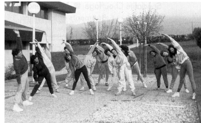
Le groupe du lundi soir

La sensation de bien être que l'on éprouve à chaque séance est bénéficiaire ensuite pour tous les sports : ski, vélo, montagne, natation, etc.