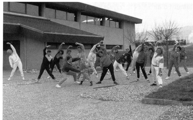
Le groupe du jeudi matin

Financièrement, notre club est autonome : une cotisation est demandée à chaque participant. Grâce à la Salle Polyvalente mise à notre disposition gracieusement par la Mairie, l'activité se poursuit 2 fois par semaine : un groupe le Jeudi matin de 8h30 à 9h30 et un groupe le Lundi soir de 18h30 à 19h30.